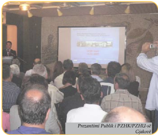
Prezantimi Publik i PZHK/PZHU-së Gjakovë