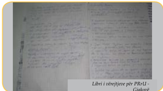
Libri i vërejtjeve për PRrU - Gjakovë