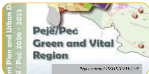
Peja e miratoi PZHK/PZHU-në