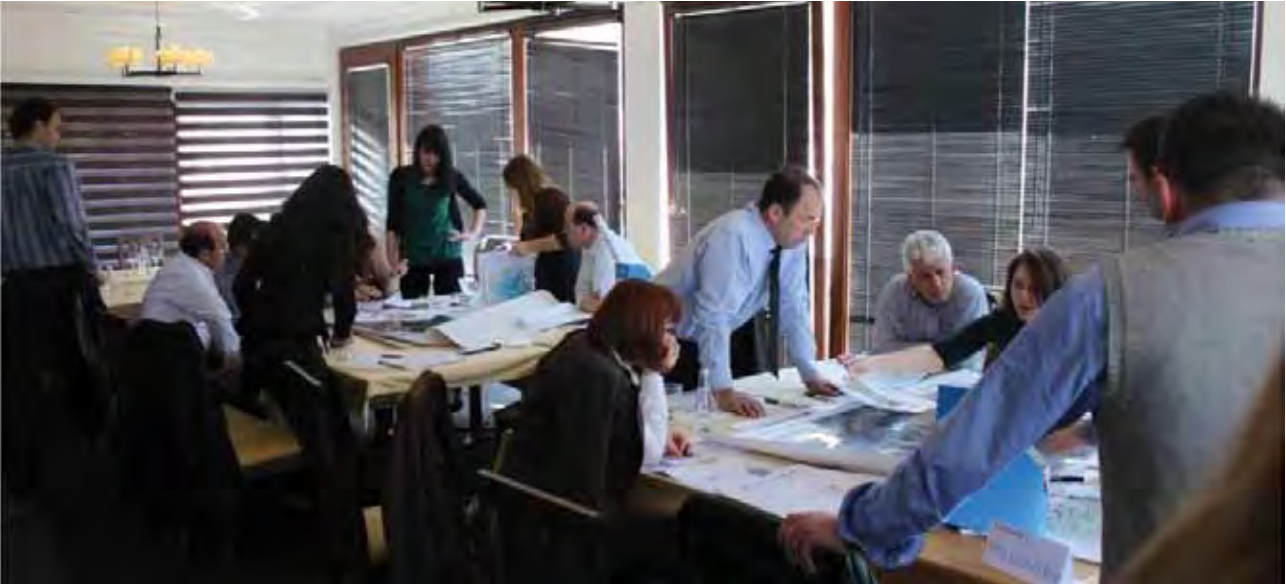
Procesi i hartimit të PZHK-së së Malishevës- Punëtorja për zhvillimin e skenarëve