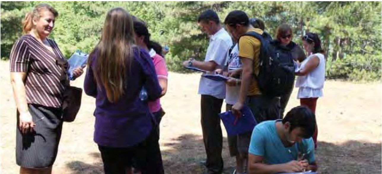
Projekti Kapital Investiv, Parku Moronica- Komuna e Junikut

Objektivat kryesore: Objektivi i përgjithshëm është krijimi i një modeli të prekshëm të projektit nëpërmjet një sërë veprimesh të zhvilluara në mënyrë pjesëmarrëse, e cila do të sigurojë vende të sigurta dhe tërheqëse për rekreacion, mësim dhe argëtim. Projekti ka për qëllim të ofroj për stafin e shkollës, nxënësit dhe komunitetin, një ambient të këndshëm dhe të sigurt për rekreacion dhe argëtim, si dhe të rris vetëdijesimin për mirëmbajtjen e tij. Projekti promovon përfshirjen e të gjitha palëve të interesit prej planifikimit, zhvillimit dhe zbatimit të projektit e deri te mirëmbajtja e tij në të ardhmen.