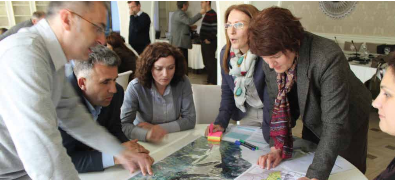
Procesi i hartimit të Planit Hapësinor për Parkun Kombëtar "Bjeshkët e Nemuna", përfshirë procesin e komponentës mjedisore/ VSM-së