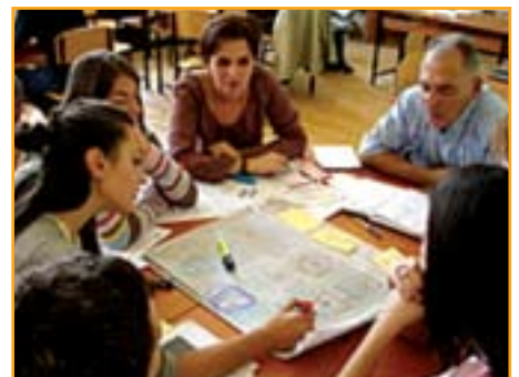
1 Artikull me ilustrime (fotografi) mbi këto ngjarje u publikua edhe në faqen e internetit të UN-HABITAT-it: www.unhabitat.org