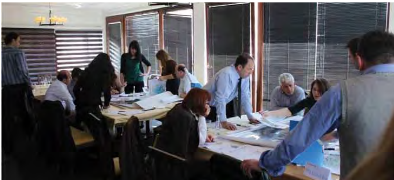
Proces izrade RPO-a Mališeva- Radionica za razvijanje scenarija