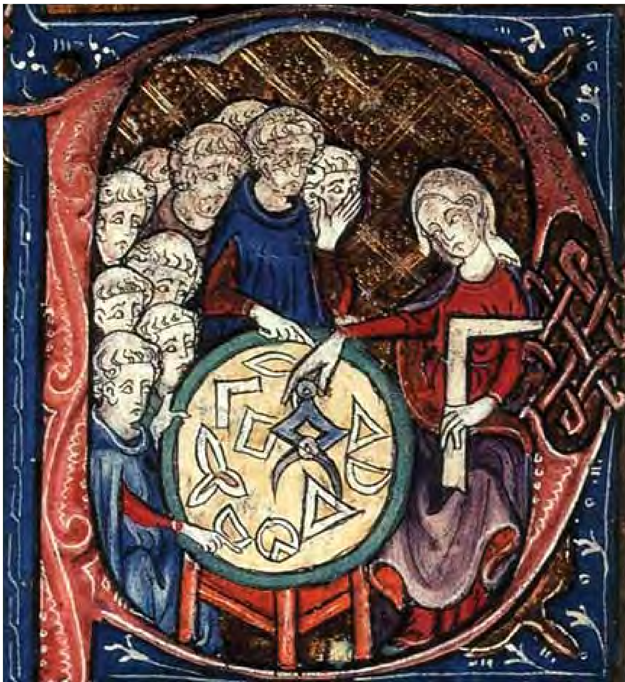
Jedna žena dok je održavala nastavu iz oblasti geometrije: Slika srednjovekovnog analitičkih filozofskih radova Iz 1265-99. godine MS Burney 275, str. 293. (Britanska biblioteka) Preštampano u The Making of the Middle Ages , R. W. Southern. London: The Folio Society, 1998. Autorsko pravo 1953. Ilustracija nakon str. 192.

Razumevanje različitih potreba i interakcije žena i muškaraca je vredna osnova za donosiocce odluka, planere, projektante i druge zainteresovane strane u procesu prostornog planiranja, tako da mogu da analiziraju i integrišu rodnu ravnopravnost u formulisanju razvojnih okvira koji odgovaraju društvenom kontekstu.