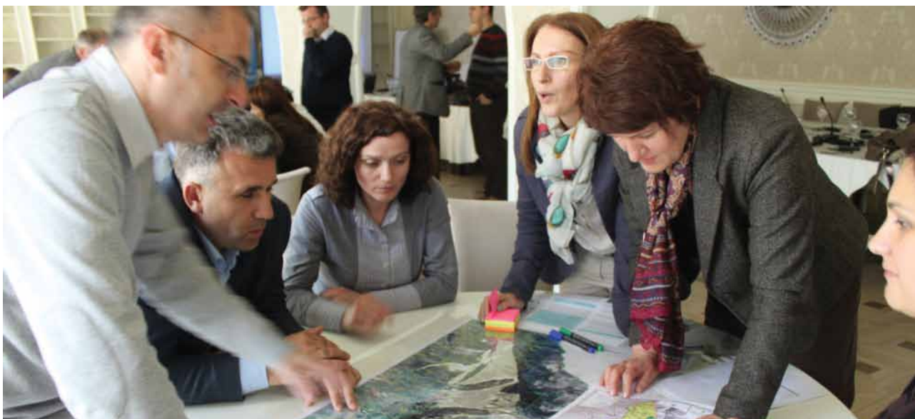
Proces izrade Prostornog Plana za Nacionalni Park "Prokletije", uključujući komponentu zaštite životne sredine/ SPUŽS-a.