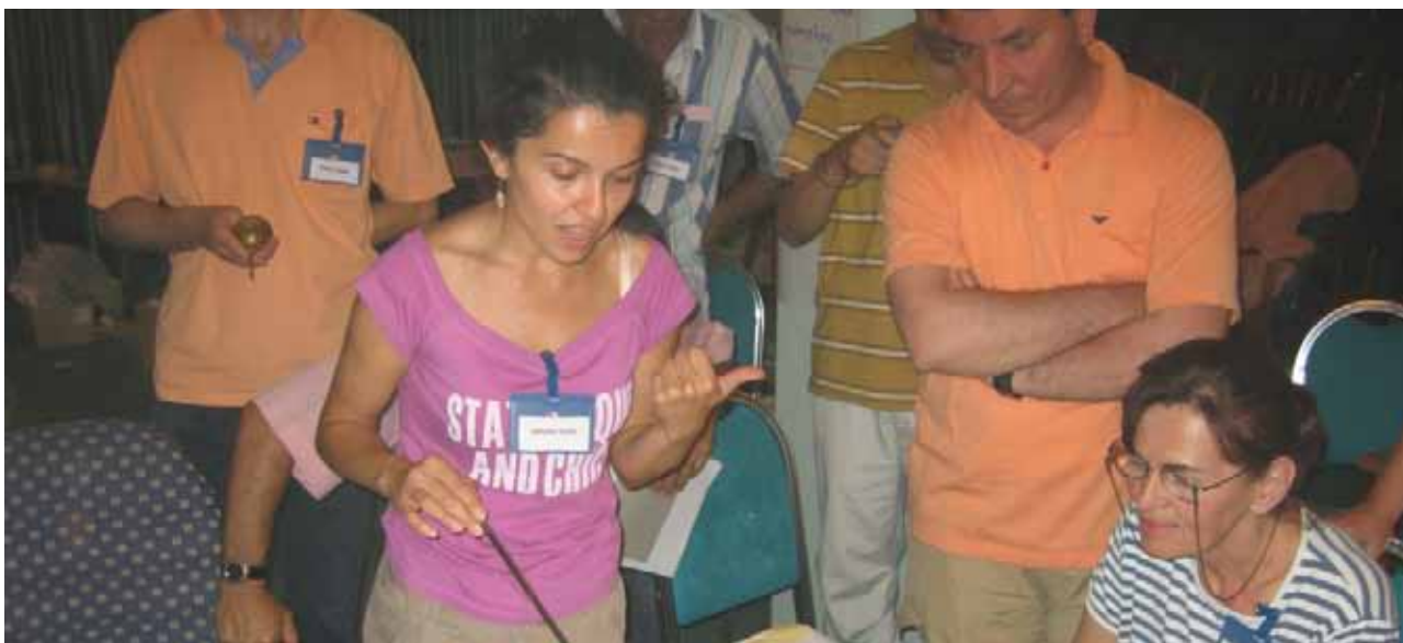
Radionica Vizioniranja- Proces planiranja u Opštini Đakovica