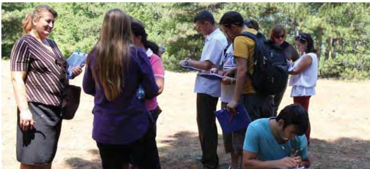
Projekat Kapitalne Investicije, Moronica Park- Opština Junik

Glavni rezultati: Participativni proces neguje angažovanje zajednice i sveobuhvatnost, obzirom na manjinske grupe, pomažući promovisanje rodne ravnoteže kroz angažovanje nastavnika, žena i devojaka u procesu projektovanja, a posebno, promovisanje učešća dece i mladih. U opštini Orahovac u proces je uključen i školski konkurs otvoren za sve osnovne i srednje škole. Konkurs koji je za cilj imao širenje javnog angažmana i podizanje građanske svesti među učenicima, nastavnicima i roditeljima. Pored stvaranja “održivog školskog dvorišta”, projekat nastoji da angažuje školsku zajednicu u timskom radu, da se poboljša mašta učenika o urbanim pitanjima i da se podigne svest o životnoj sredini. Projekat se takođe pokazao uspešnim u rešavanju oskudice opštinskih resursa, odnosno zemljišta raspoloživim za investicije za javne prostore, i mehanizama za rešavanje održavanja javnih površina.