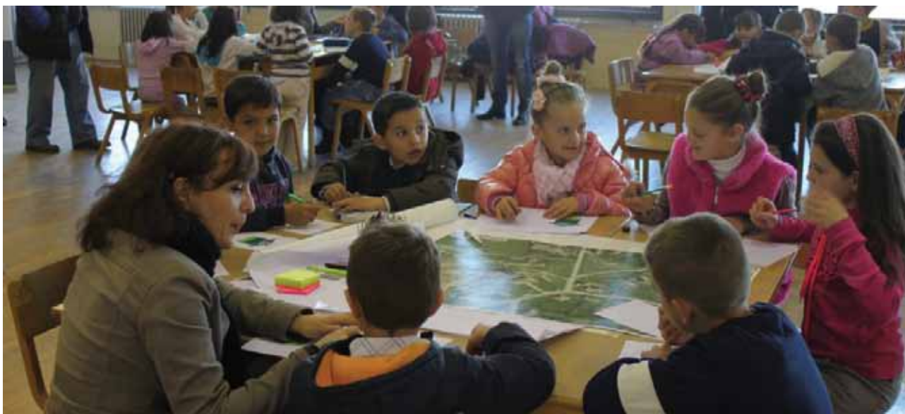
PKI Gračanica, roditelji, nastavnici i učenici stavljaju prve ideje na papir za školsko dvorište

Tokom ove faze se preporučuje razvijanje kompilacije o uticajima i efektima akcija i potrebnih intervencija iz rodne perspektive. Preporučuje se da se ova kompilaciju da tokom javne prezentacije. Konačni nacrt prostorno planskog dokumenta treba da obezbedi da se rodna perspektiva uključi kao poglavlje o procesu, opisujući učešće aktera (muškarci i žene) i pomagala koja se koriste za prikupljanje mišljenja i inputa (npr. analiza aktera, prema polu razvrstani podaci, sastanci, ispitivanja javnog mnjenja, vizionarske radionice, radne grupe i sl.)