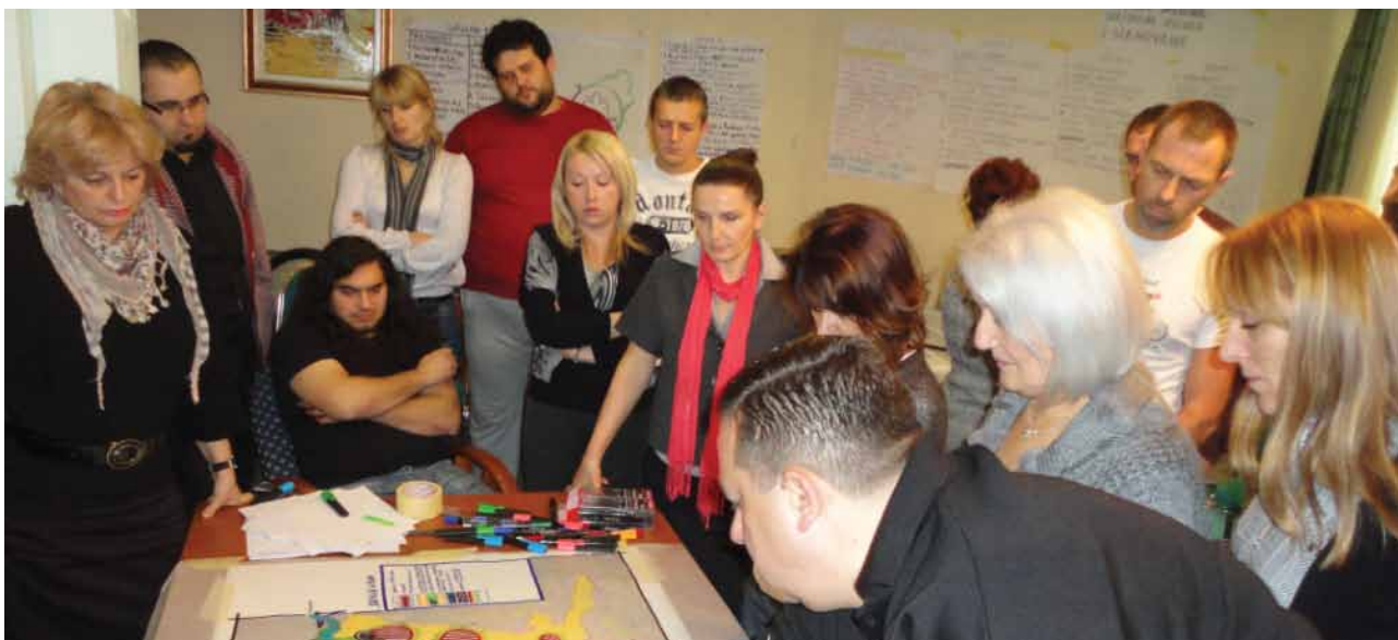
Proces izrade RPO-a Gračanice